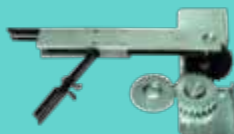
Kit apertura 180°