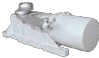
Operador Roller protegido con pintura de poliéster