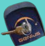
Switch de llave