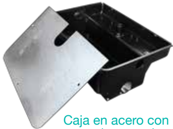
Caja en acero con tratamiento anticorrosivo tapa acero galvanizado

El mantenimiento es mínimo y está facilitado por la posibilidad de acceder al operador sin tener que desmontar la reja o puerta. La óptima eficacia mecánica del sistema asegura un consumo de energía eléctrica limitada.