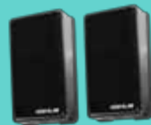
Fotoceldas de seguridad